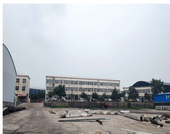
项目北侧今良农业办公楼