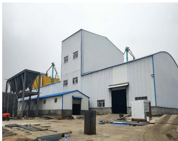
项目西侧今良农业车间