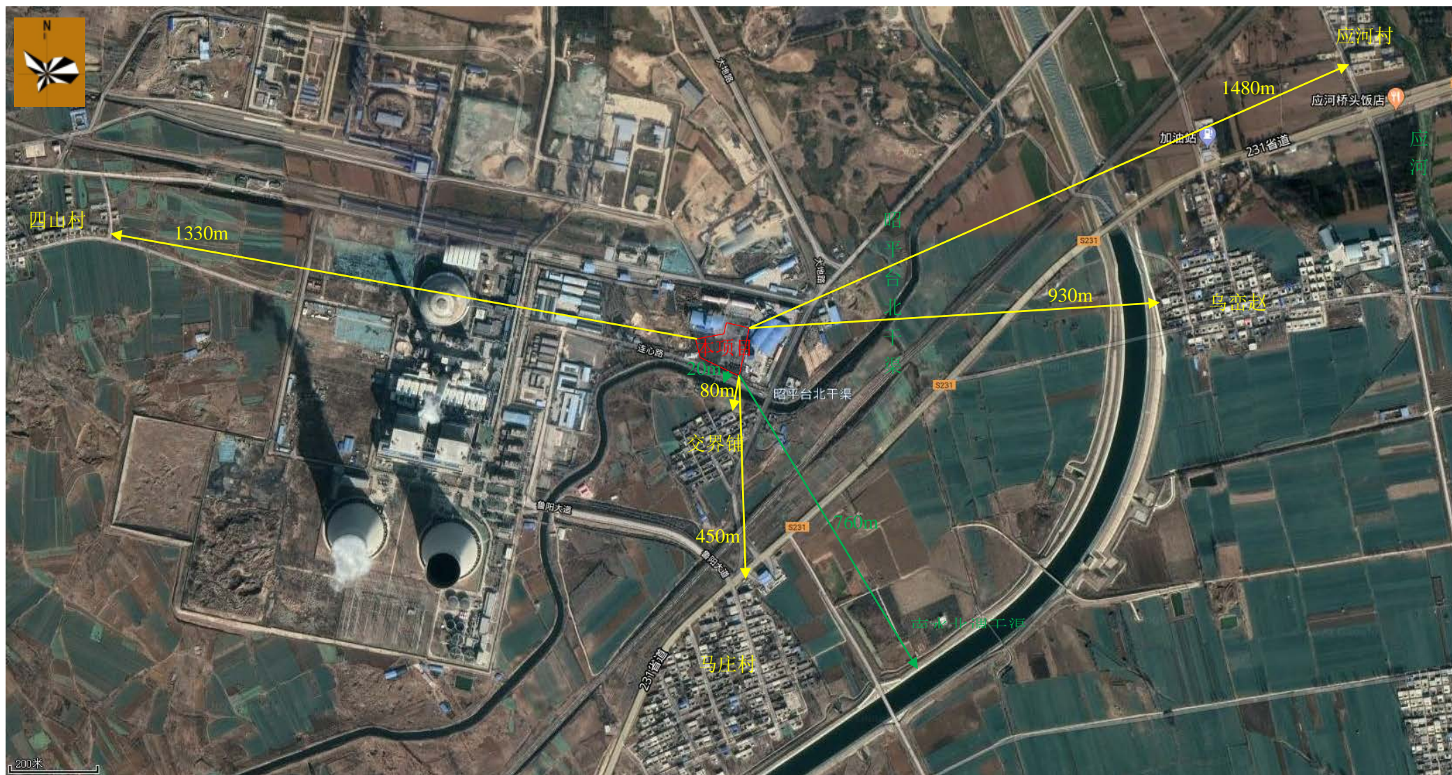
附图2 项目周边环境示意图