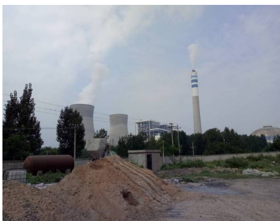
项目西南平顶山发电分公司