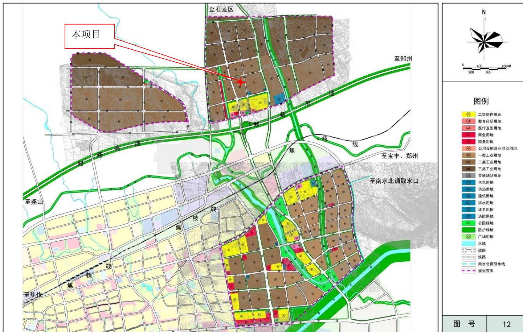
附图 3 产业集聚区规划图