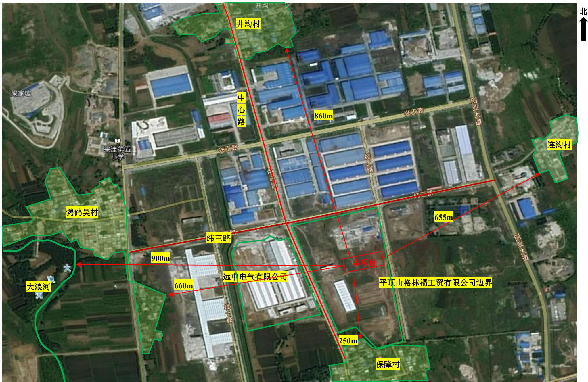
附图2 项目周边环境示意图