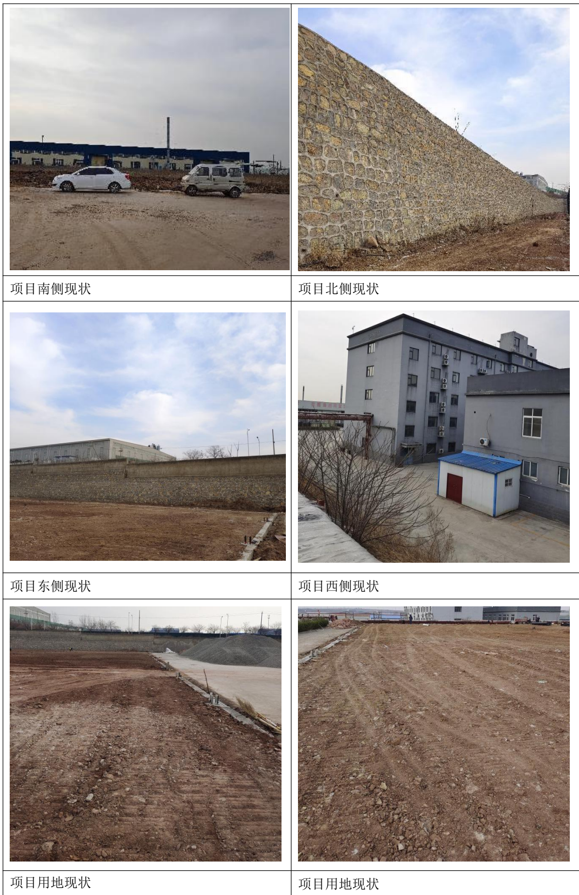
附图 5 项目周边现状图