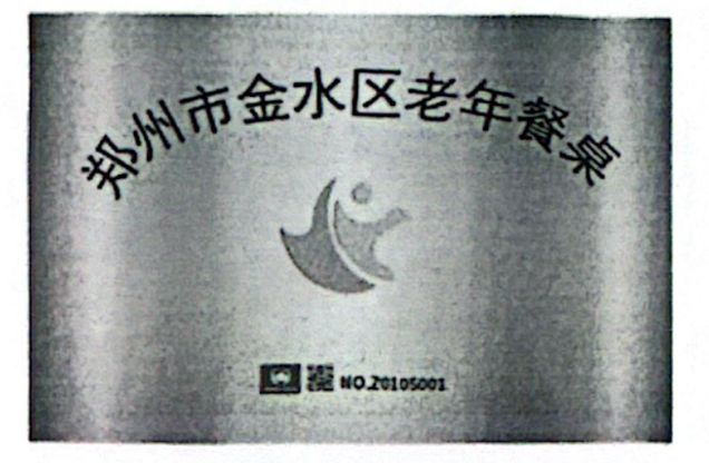
图 2: 老年餐桌标识牌参考