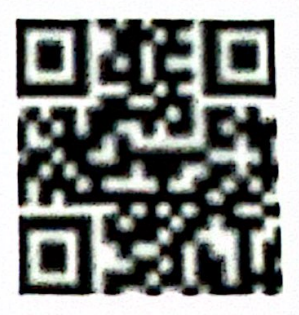
图 6: 老年助餐服务场所基本信息识别二维码(按需生成)